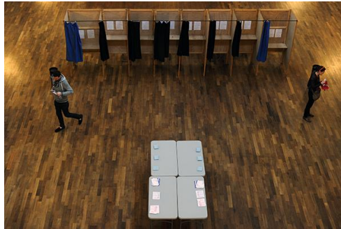
Les Lyonnaises et les Lyonnais sont appelés à voter. © Olivier Chassignole - Photo d'illustration

Les élections municipales et métropolitaines des 15 et 22 mars approchent à grands pas. En amont du scrutin, Tribune de Lyon tente de répondre à quelques questions concrètes.