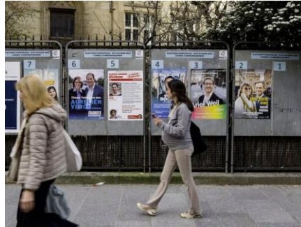
Les élections municipales se tiendront les 15 et 22 mars.

Affiches tricolores, bulletins distribués trop tard, maires qui inaugurent à tout-va : en période électorale, les faux pas sont légion. Et leurs conséquences souvent fatales.