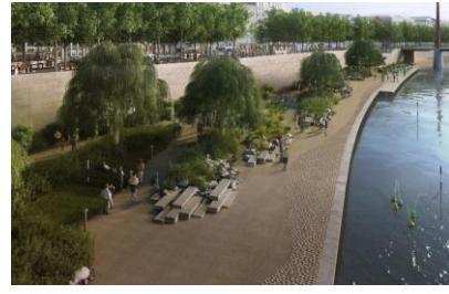
La partie haute des terrasses de la Presqu'île inaugurées à Lyon vendredi 4 juillet 2025.

Photo montage des futurs quais de Saône