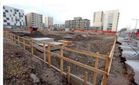
L'îlot D3 en chantier à Lyon Confluence, situé à l'angle du cours Charlemagne et de la rue Montrochet.

À raison de 5 à 6 bâtiments voire davantage, pour chaque nouvel îlot construit, la Confluence n'en finit pas de grandir. Selon les chiffres donnés par l'aménageur, le site de la Confluence comptera à l'horizon 2032, 25 000 salariés et 17 000 habitants. Le nouveau chantier qui vient de s'ouvrir à l'angle du cours Charlemagne et de la rue Montrochet, face au siège de la Région Auvergne-Rhône-Alpes vise à réaliser cinq bâtiments. « Les terrassements assez importants viennent de commencer », confirme Samuel Linzau, directeur de la SPL Lyon Confluence.