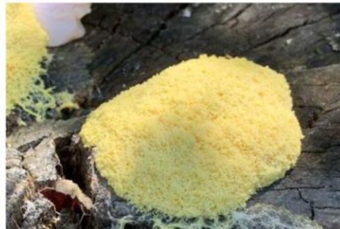
Un blob n'est ni une plante, ni un animal. Ce spécimen fidésien est exceptionnel.

Et la scientifique passionnée de poursuivre. « Cet organisme est inoffensif et très important pour son environnement naturel. Composé d'une seule cellule, il est quasiment immortel. En effet, cette petite bête ne craint que la lumière et la sécheresse, et peut entrer dans un état d'hibernation dès que les