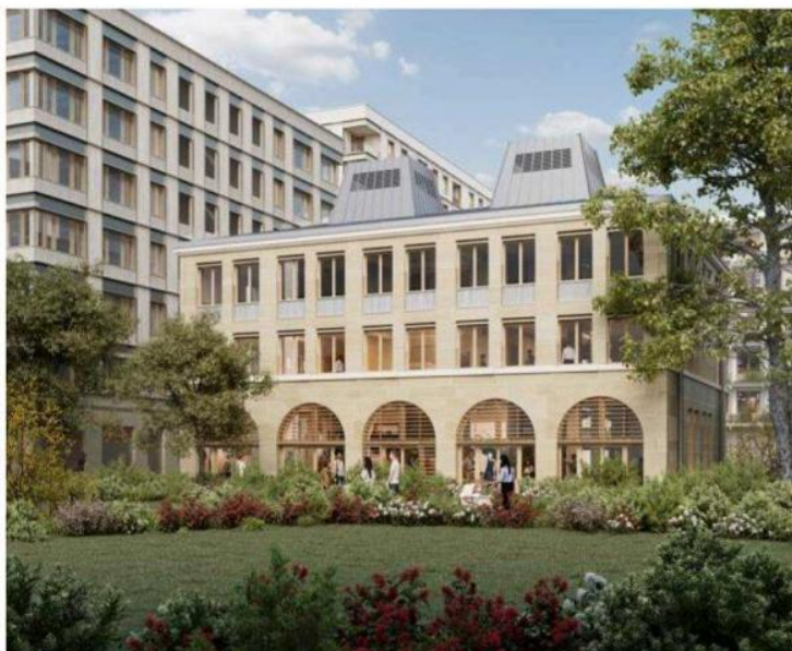
Le bâtiment viendra se glisser dans le projet La Hora, un îlot de 5 immeubles qui seront construits le long du cours Charlemagne. Visuel Octav Tirziu